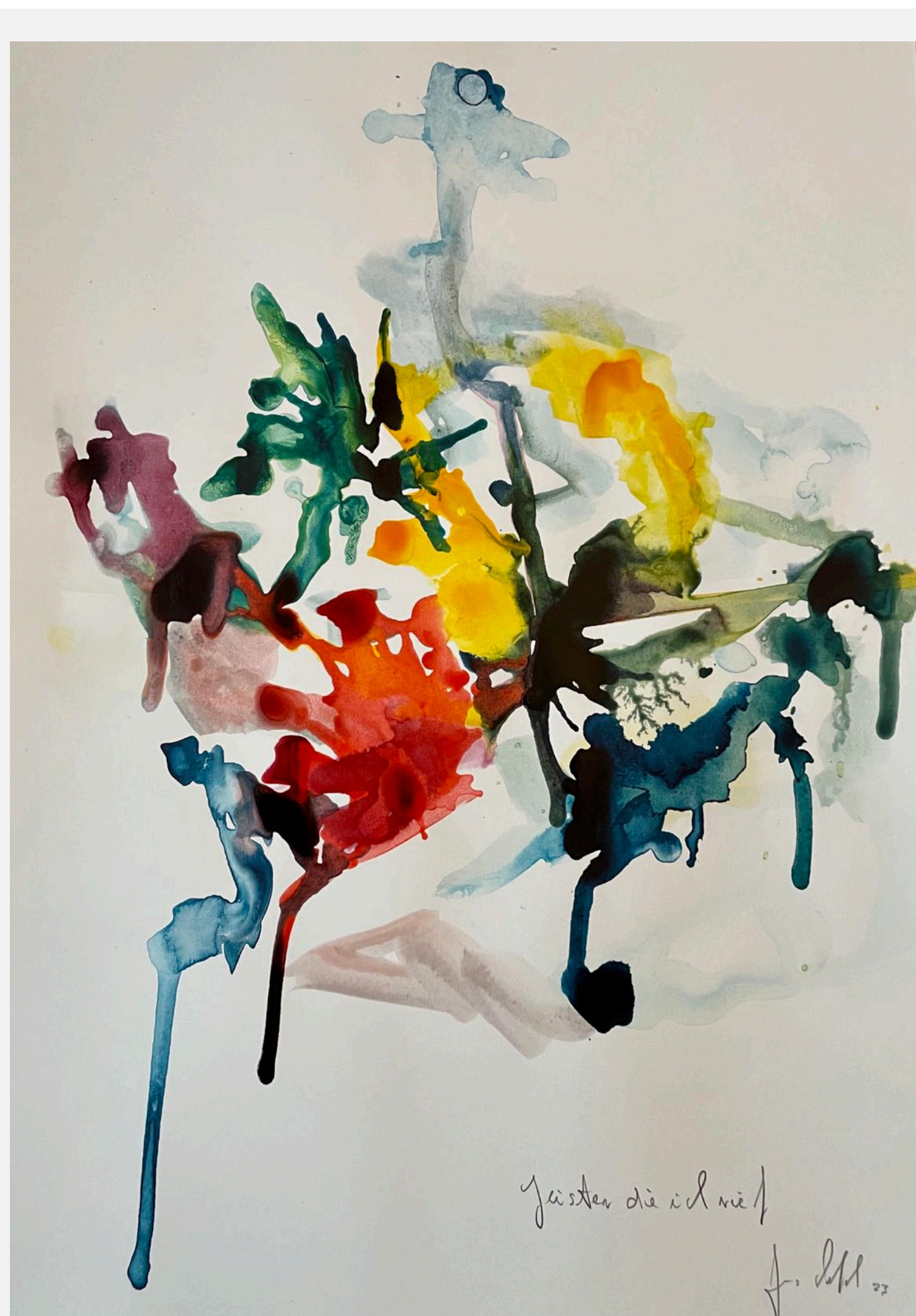
Geister die ich rief

Wenn die Bilder in dieser E-Mail nicht richtig angezeigt werden oder Sie diese im Browser ansehen möchten, bitte oben auf 'Online-Version anzeigen' klicken.