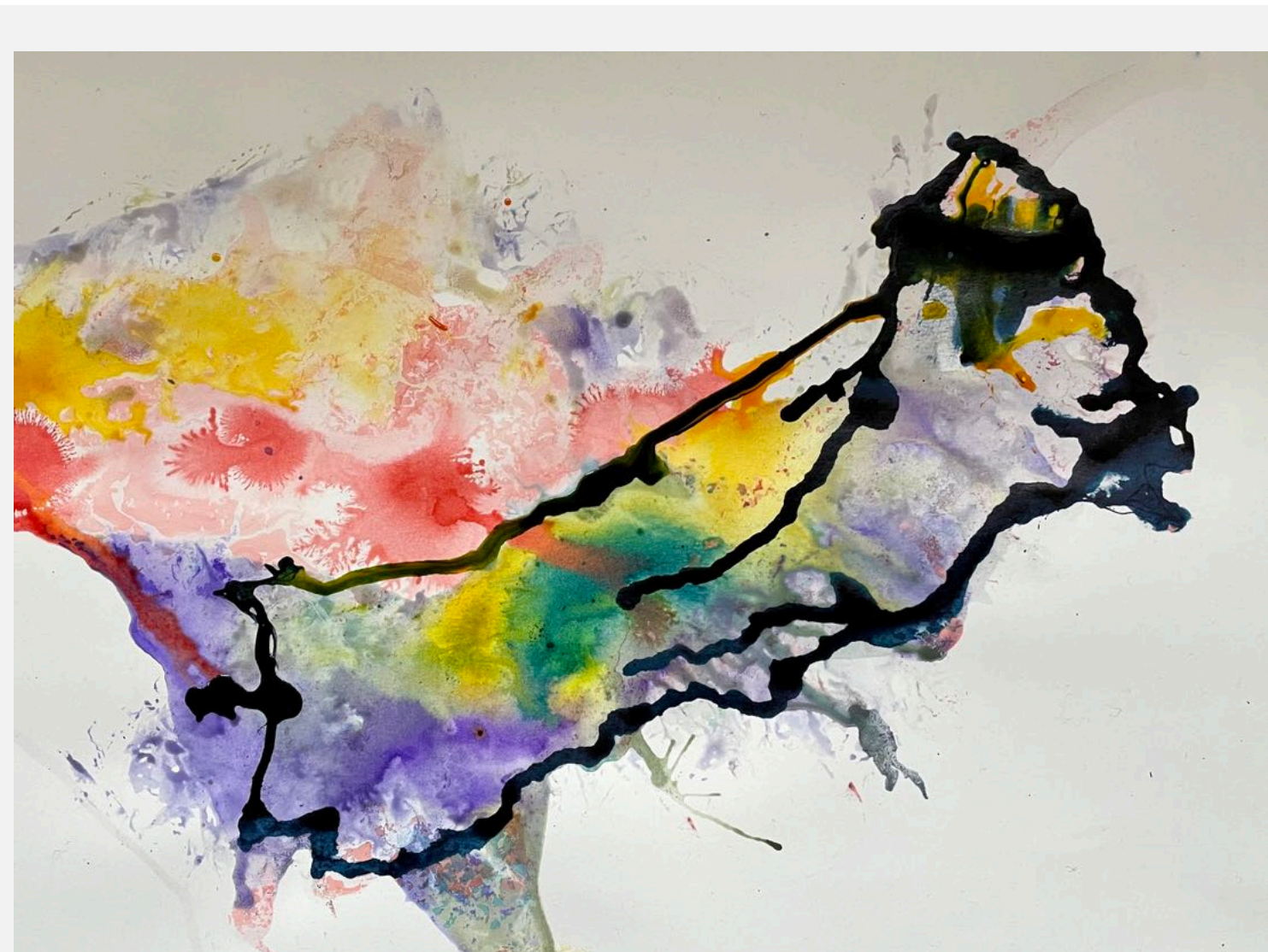
Einen Rahmen geben

In dieser kleinen Arbeit, die ruhig begann, bricht sich plötzlich eine Energie Bahn, welche die Hülle sprengt und auflöst. Mitunter bieten sich beim Betrachten noch andere Assoziationen an?