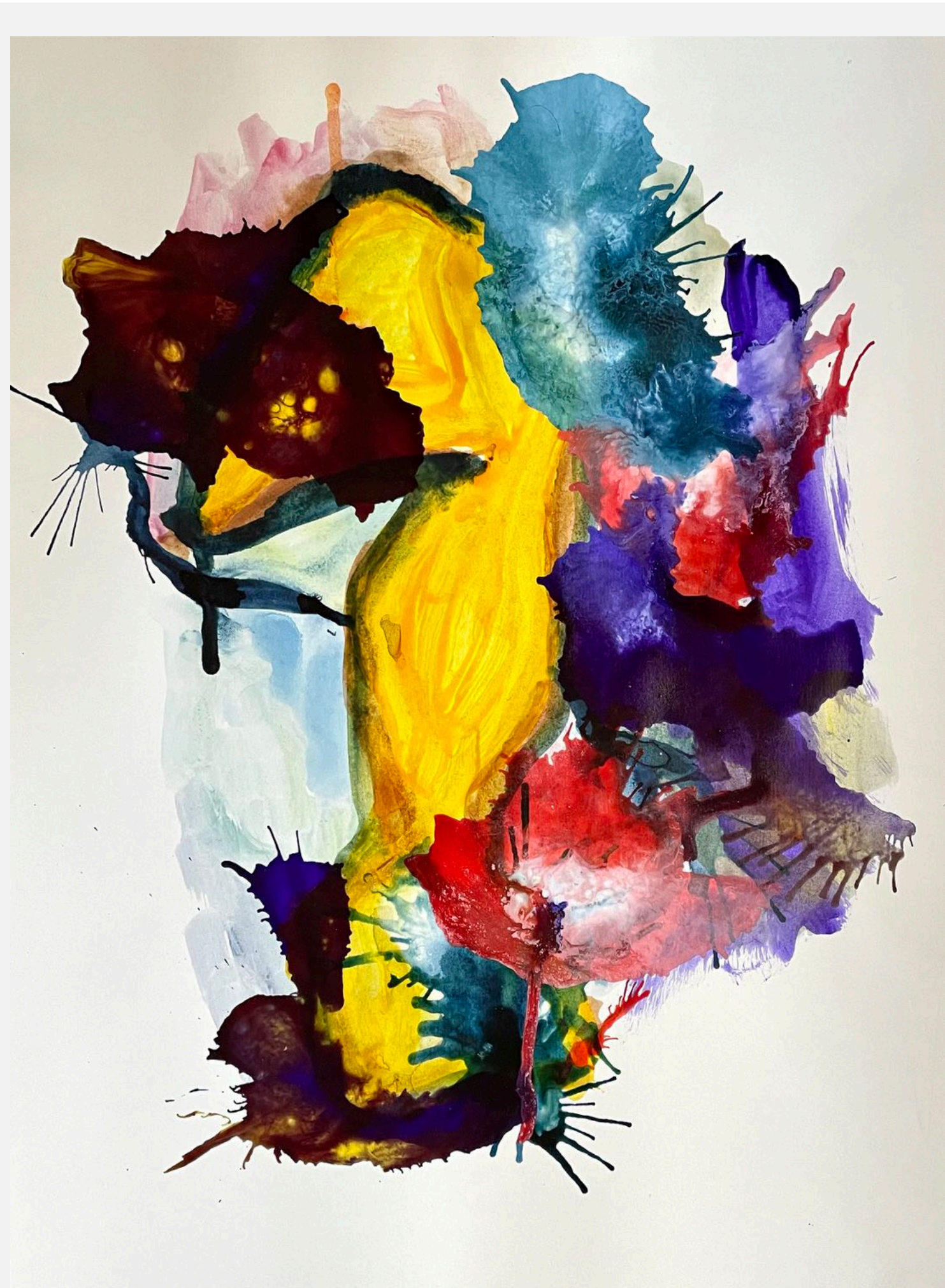
Ente beim Maskenball

Diese für mich sehr emotionale Arbeit bezieht sich auf den Spruch aus Goethes 'Zauberlehrling'. Dieser geht mir oft durch den Sinn, wenn ich das aktuelle weltpolitische Geschehen betrachte. Haben wir diese Geister wirklich alle gerufen?